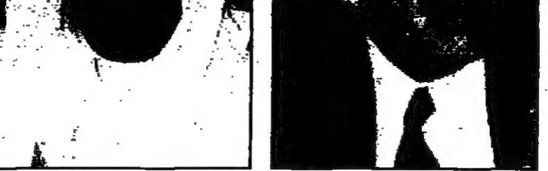
عبد الحفيظ الروابدة

اعتبرته الأحزاب خطرا على استقرار النظام انشقاقات واستقالات داخل الحزب الدستوري الأردني. وقالت الأحزاب: «نحن ندين هذا الهجوم بشدة ونطالب بالتحقيق الفوري في الحادث». اعتبرته الأحزاب خطرا على استقرار النظام انشقاقات واستقالات داخل الحزب الدستوري الأردني. وقالت الأحزاب: «نحن ندين هذا الهجوم بشدة ونطالب بالتحقيق الفوري في الحادث».